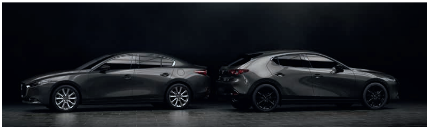
MACHINE GRAY (46G)