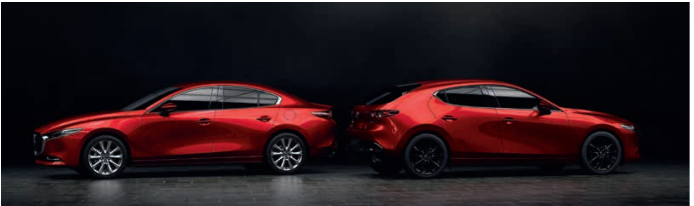
SOUL RED CRYSTAL (46V)